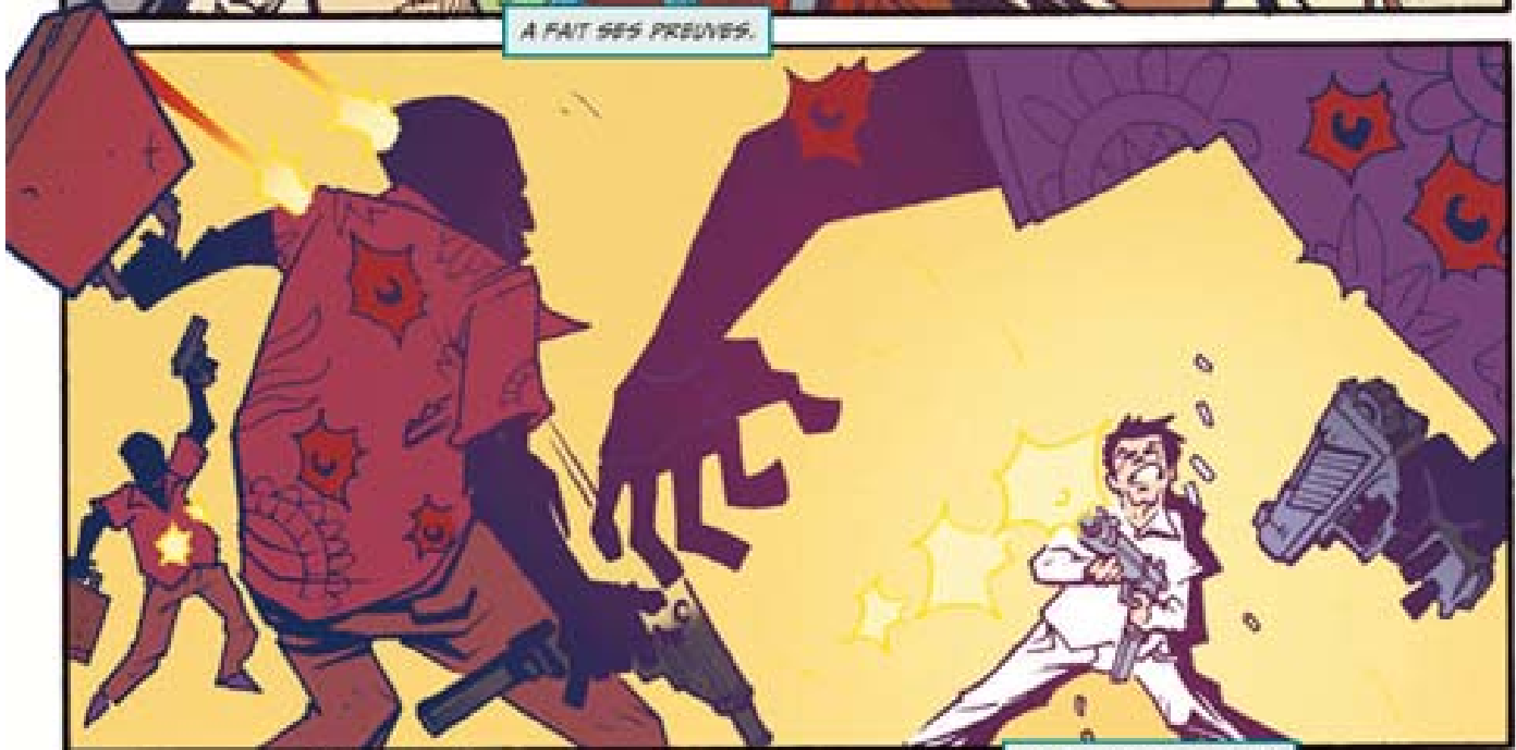
A GRAY LES ÉCHELONS.