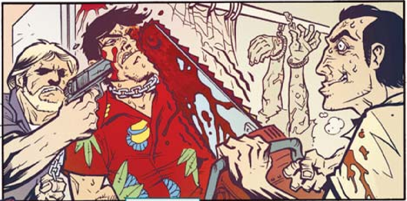
A FAIT SES PREUVES.